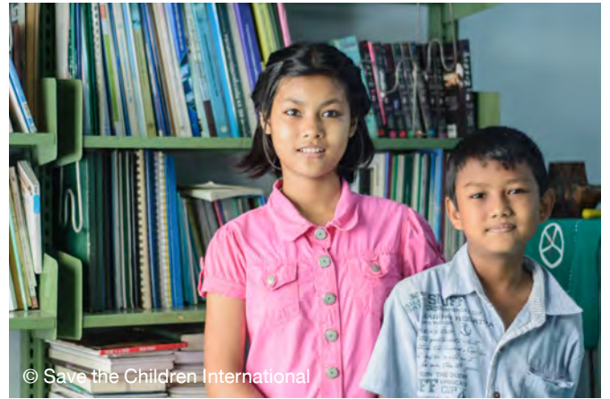
ภาพเด็กข้ามชาติ

ในระดับโรงเรียน มูลนิธิเพื่อเยาวชนชนบททำงานร่วมกับโรงเรียนต่างๆ เพื่อสร้างความเข้าใจและความรู้สึกเห็นอกเห็นใจในกลุ่มผู้บริหารโรงเรียน และครูในการรับเด็กข้ามชาติเข้าเรียนในชั้นเรียนโดยการประชุม การจัดกิจกรรมสร้างความตระหนัก และการจัดทำคู่มือเพื่ออธิบายขั้นตอนการลงทะเบียนของเด็ข้ามชาติภายใต้นโยบายการศึกษาเพื่อป้องกันเรื่องนี้เป็นสิ่งสำคัญเนื่องจากบางโรงเรียนเห็นว่าการปฏิบัติตามขั้นตอนการลงทะเบียนสำหรับนักเรียนที่ไม่มีเอกสารเป็นเรื่องยากลำบาก ความสนับสนุนเพิ่มเติมสำหรับคณะผู้บริหารและครูในโรงเรียนรวมถึงการสัมมนา การประชุมเชิงปฏิบัติการและการเยี่ยมชมโรงเรียนเพื่อศึกษาเทคนิคการสอนและกลยุทธ์ที่เป็นประโยชน์ต่อผู้เรียนทุกคนในห้องเรียน