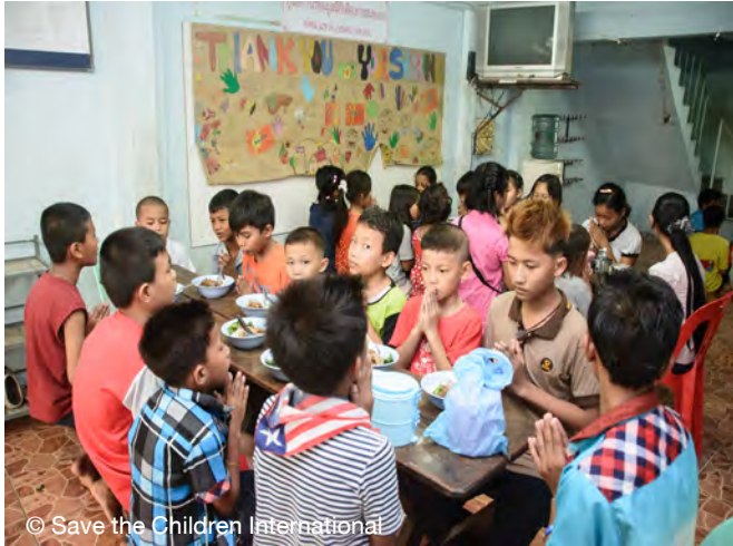
ภาพรับประทานอาหารกลางวันที่ศูนย์การเรียนรู้

ขั้นตอนแรกของการเข้าถึงเด็กข้ามชาติ คือ การระบุว่ามีเด็กเหล่านี้อยู่ที่ไหนบ้าง ดังนั้น มูลนิธิเพื่อเยาวชนชนบทจึงจัดทำแผนที่ชุมชนและทำการสำรวจเด็กที่อยู่นอกโรงเรียนเพื่อรวบรวมข้อมูลที่ถูกต้องแม่นยำเกี่ยวกับถิ่นที่อยู่และประวัติของเด็กข้ามชาติ จากจุดนี้ ภาคประชาสังคมและรัฐบาลสามารถวางแผนเพื่อนำเด็กเหล่านี้เข้าสู่โรงเรียน